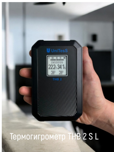
Термогигрометр THB 2 S L

Измерение и отображение температуры и относительной влажности воздуха. Сохранение истории измеренных значений. Считывание накопленных данных через USB порт (Type-C).